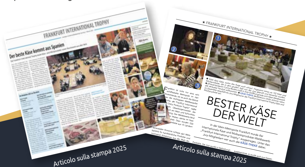
Articolo sulla stampa 2025

I risultati sono stati pubblicati in un'edizione speciale rivolta a lettori con un elevato potere d'acquisto e una passione per la cultura e gli eventi.