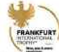
Beste Destilliererei Deutschlands 2026

So etwas nennt man wohl eine echte Glückssträhne! Im fünften Jahr in Folge gewinnt die innovative Traditionsdestilliererei aus Nistertal im nördlichen Rheinland-Pfalz den begehrten Titel. Und dazu noch 10 weitere Medaillen.